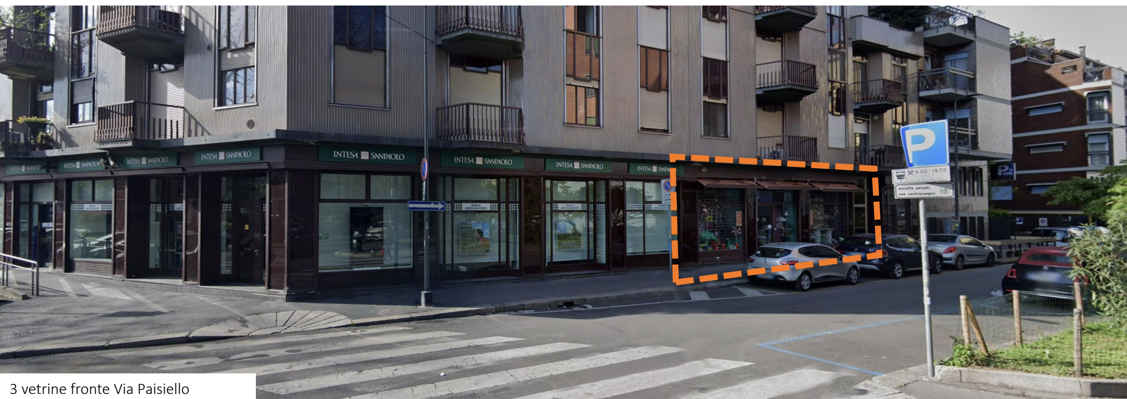
3 vetrine fronte Via Paisiello